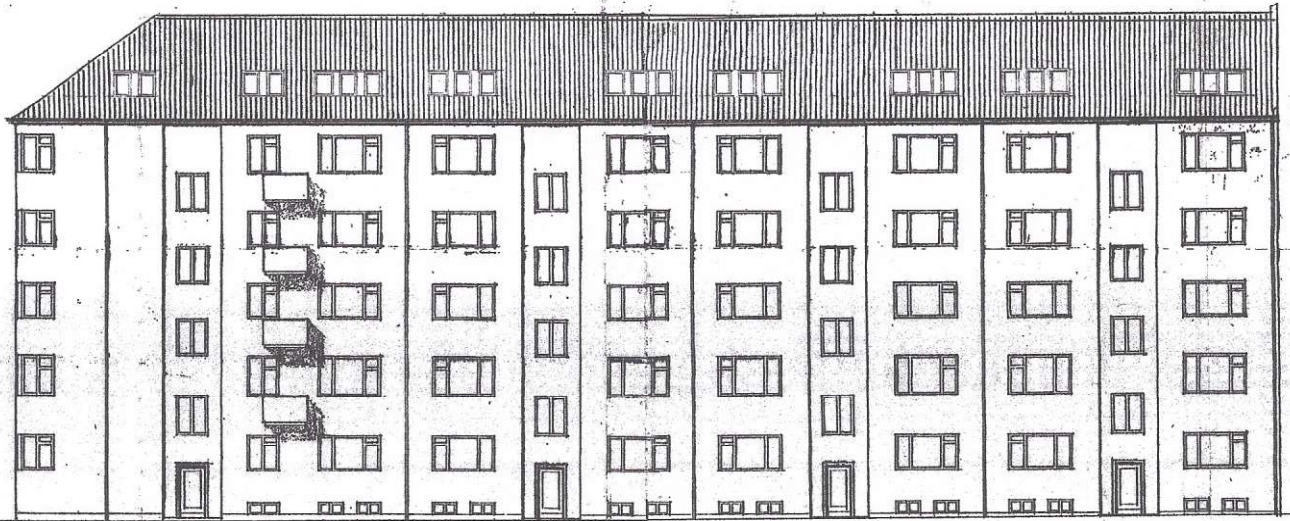
Stands med Stiehall. 1:100.